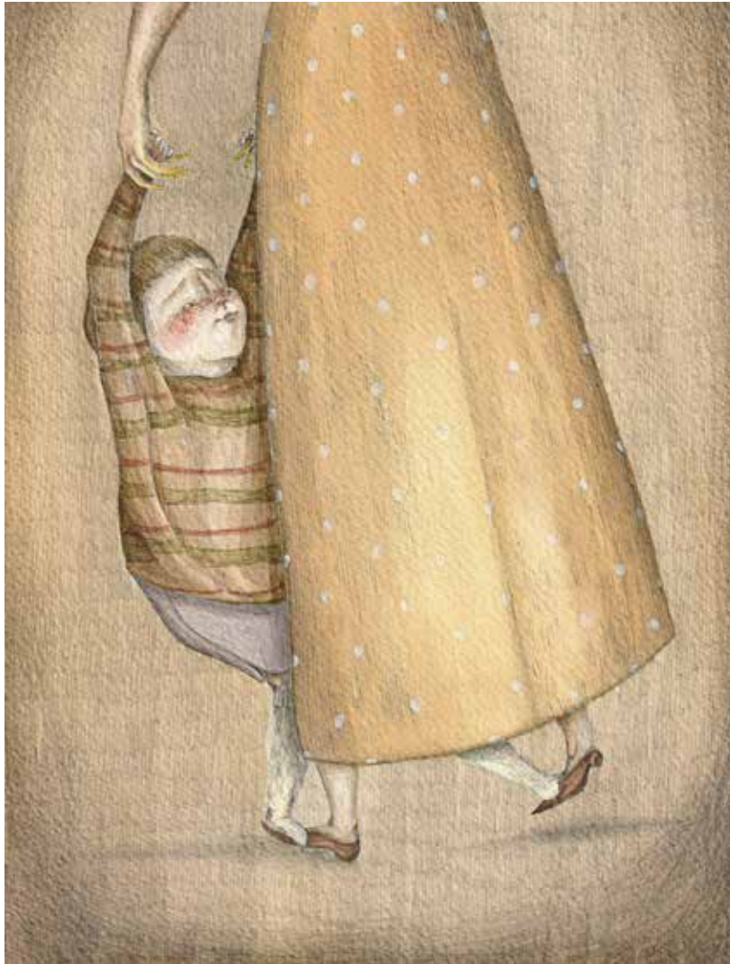
2020, tecnica mista ecoline, matite e grafite su carta, 21x30 cm

Di te mi mancano quei balli lungo tutta la notte, io in equilibrio sui tuoi piedi ad acchiappare le stelle, le scartavo come caramelle. In tasca, stamattina, solo cartacce ma in bocca sento ancora il dolce.