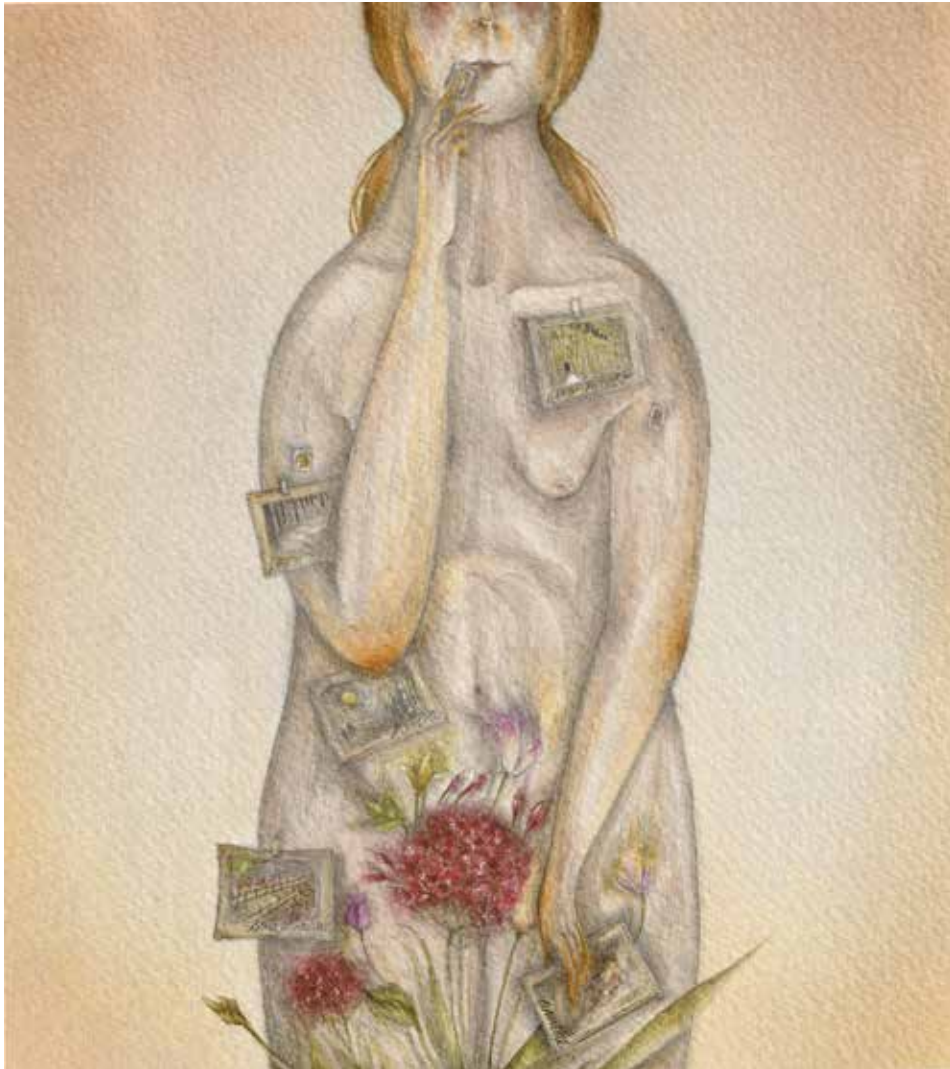
2021, tecnica mista ecoline, matite e grafite su carta, 21x30 cm

Ho spedito una cartolina ad ogni difetto del mio corpo per mostrargli che in realtà è un bellissimo panorama.